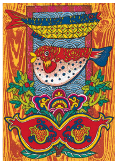
陳永欽 絹版 榴開富貴慶有餘